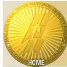
Premio Malcom Baldrige