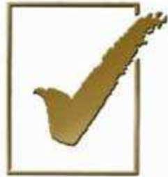
PREMIO NACIONAL DE CALIDAD Modelo Nacional para la Calidad Total